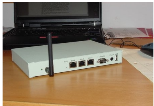
Obrazek 1: Soekris net4801 z anteną WiFi

Sercem modeli net4521 i net4526 jest procesor AMD ElanSC520 (i486, taktowanie 133 Mhz), a modeli net4801 i net4826 – NSC/AMD Geode SC1100 (i586 MMX, taktowanie 266 Mhz). Wyposażone mogą być w pamięć SDRAM do ilości 256 MB, karty pamięci Flash i dysk 2.5 cala, kartę PCI, PC-Card/Cardbus oraz Mini-PCI. Interfejsami wejścia/wyjścia jest Ethernet, USB, port szeregowy oraz port I/O ogólnego przeznaczenia. Co istotne ten miniaturowy komputer pobiera maksymalnie tylko 15 wat mocy, a temperatura pracy od 0°C do 60°C.