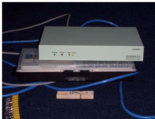
Obrazek 3: Soekris net4801 z przodu

Podstawową wadą Soekrisa w stosunku do PC/104 jest brak odpowiedniej ilości portów we/wy dla typowych zastosowań przemysłowych (np. jako stacji pomiarowej). Na pewno PC/104 oferują większe bogactwo rozwiązań, ale Soekris nie jest tu na przegranej pozycji. Port USB pozwala podłączyć